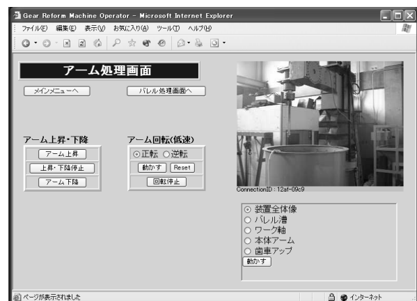
図 2: WWW 操作インターフェース

サーバ機能を持ち、インターネット上から WWW ブラウザを用いて、カメラの制御および映像の取得を行うことができる。ただし、この WWW カメラは IPv4 のみの対応であるので、IPv6 で中継を行う CGI プログラムを作成した。また映像の表示は、Java アプレットを作成し、それを用いて行った。